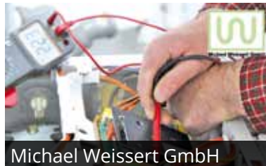
Michael Weissert GmbH