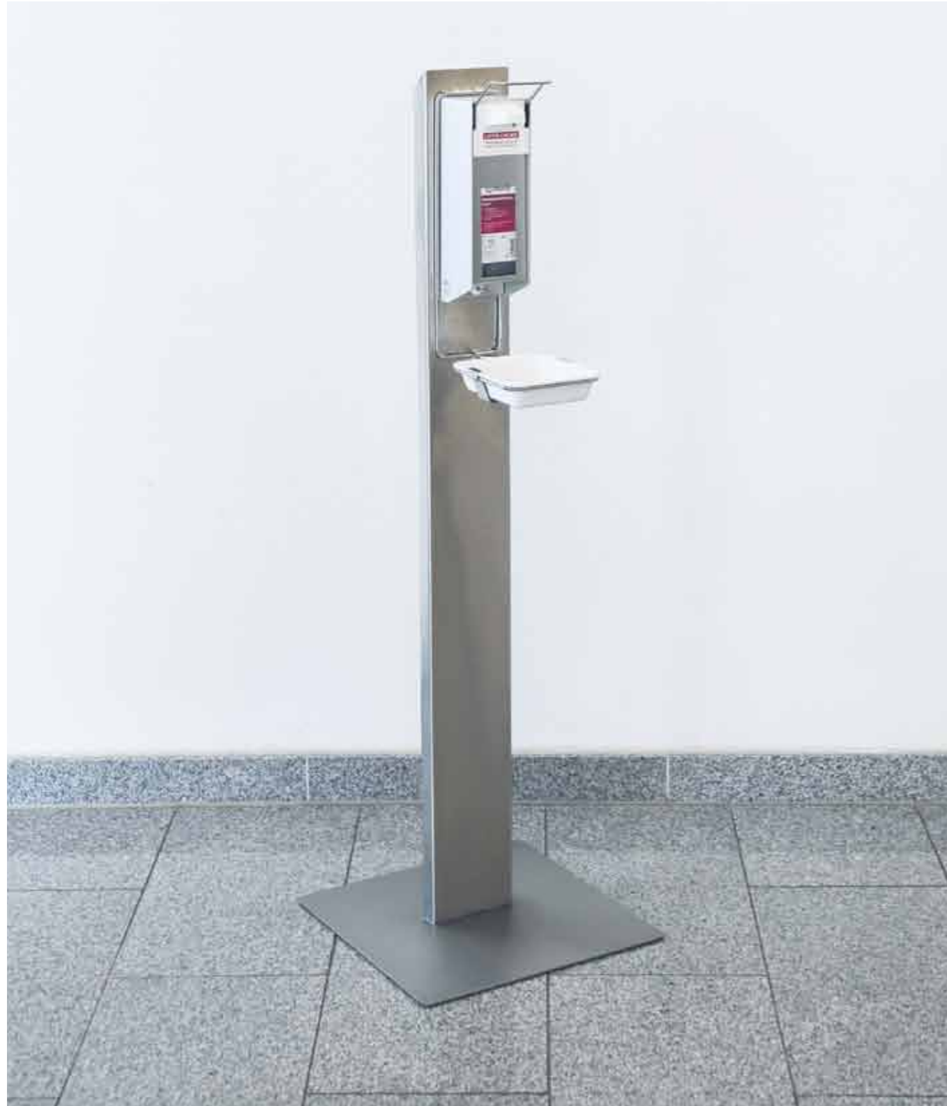
Desinfektionssäule mit Zubehör.