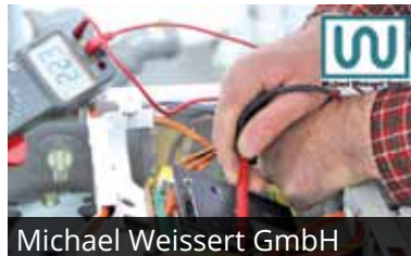
Michael Weissert GmbH